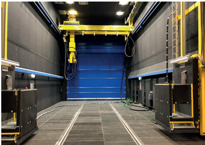
SLF-Strahlraum mit Strahlroboter ReCo-Blaster®, kranbrücken-geführt in Drehvorrichtung

Insbesondere im Schwerlastbereich kommt es auf Qualität, Stabilität und Sicherheit an. Vorteilhaft ist es daher, wenn Sie für die gesamte Anlagentechnik nur einen verlässlichen Ansprechpartner haben. Bei SLF erhalten Sie alles aus einer Hand! Ob Vorbehandeln, Strahlen, Lackieren oder Fördern – an unserem Standort Emsdetten werden alle Komponenten exakt aufeinander abgestimmt und erfüllen so höchste Ansprüche in Ihrem Produktionsprozess. Auch die Montage und den Service bei unseren Kunden vor Ort führen unsere erfahrenen Mitarbeiter persönlich aus.